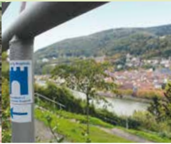
Blick vom Philosophenweg