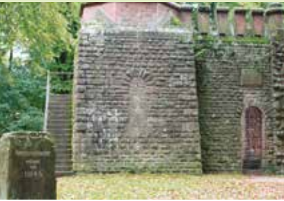
Ruine des Stephanskloster Heidelberg