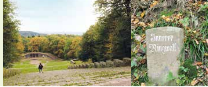
Thingstätte auf dem Heiligenberg

Nach Ausgrabungsergebnissen ist die turmartige Festung ins 11. Jahrhundert datiert worden. Nutzer waren Untergebene der Schauenburg. Sie haben diesen Herrenhof in der zweiten Hälfte des 14. Jahrhunderts ausgebaut. Mit der Errichtung neuer Burgmannenhäuser in der Schauenburg selbst geben sie das Mauersechseck um 1420/31 auf. Die Ruine befindet sich heute im Besitz der Gemeinde Dossenheim und ist öffentlich zugänglich.