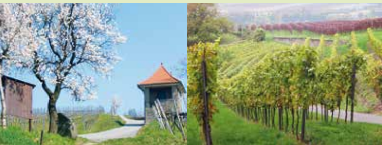
Blüten und Wein prägen die Landschaft der Bergstraße