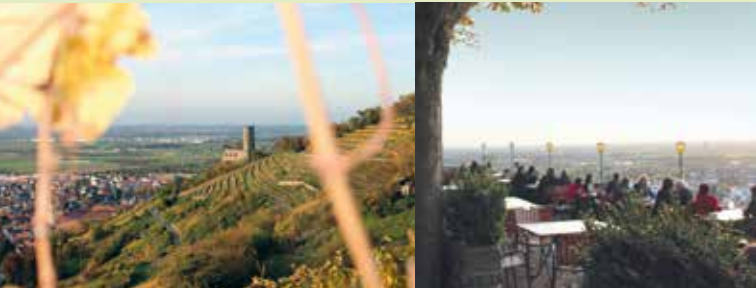
Die Strahlenburg oberhalb von Schriesheim