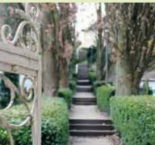
Aufgang zum Goldschmidts Park