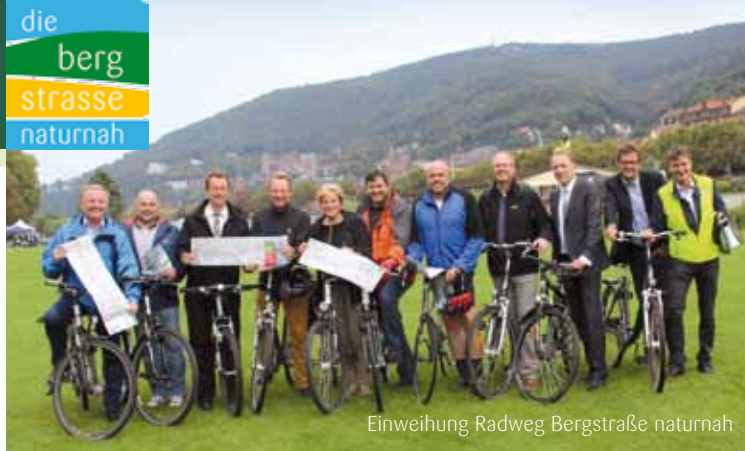
Einweihung Radweg Bergstraße naturnah