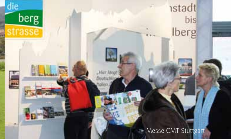
Messe CMT Stuttgart